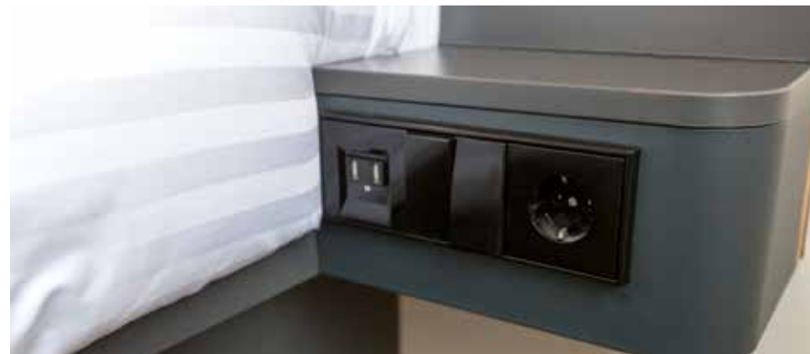
▲ Met de krachtige USB laadcontactdozen kunnen de gasten hun mobiele apparatuur opladen naast het bed

Passend bij de strakke en eenvoudige inrichting is hier gekozen voor de no-nonsense vormgeving van