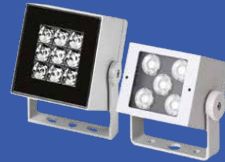
^ Superlight Nano 3 en Superlight compact Micro