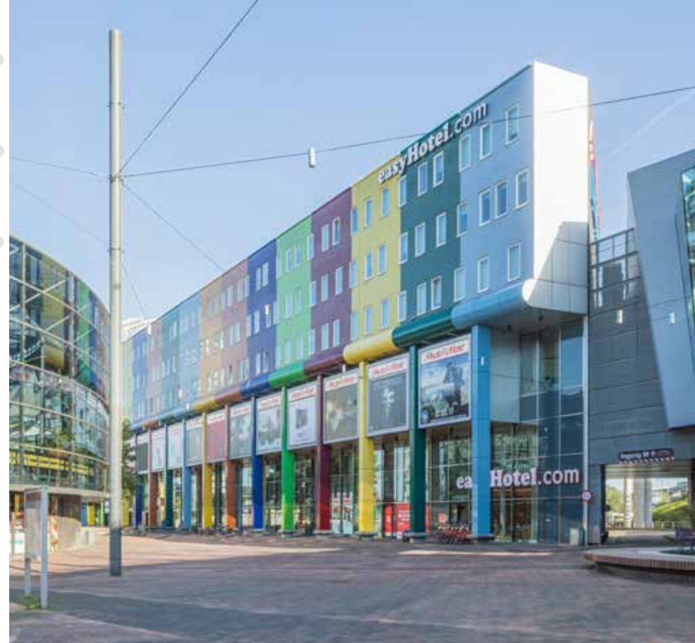
▲ Kleurrijk, comfortabel en betaalbaar - easyHotel Amsterdam Arena Boulevard

LS 990 zwart in de kamers en algemene ruimtes en LS 990 alpine wit voor de badkamers.