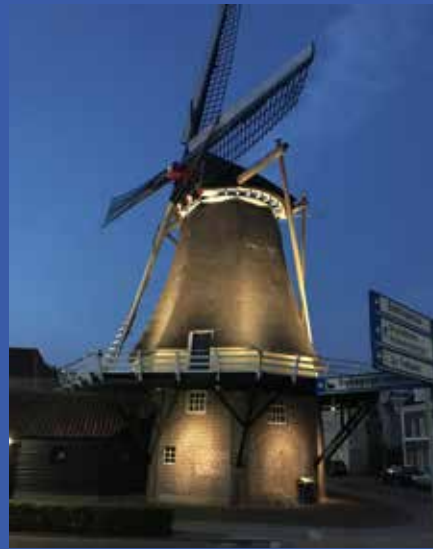
^ De gerichte lichttechniek van de Meyer Superlights voorkomt lichtvervuiling in de omgeving