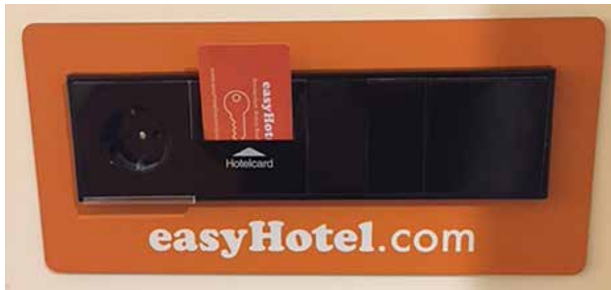
▲ Energiezuinige hotelcardschakelaar met veilige oriëntatieverlichting voor 's nachts

Zo heeft Vika Winkelinrichtingen in de meubels de krachtige JUNG USB-laadcontactdozen gemonteerd, zodat de gasten hun mobiele apparatuur kunnen opladen naast het bed en aan het wandmeubel. Met de datacontactdoos kunnen gasten op de superior kamers hun computer aansluiten op bedraad internet.