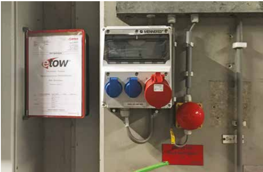
^ Nieuwe situatie, slechts één kabel aansluiten en de beveiligingen ter plekke, levert grote tijdsbesparing