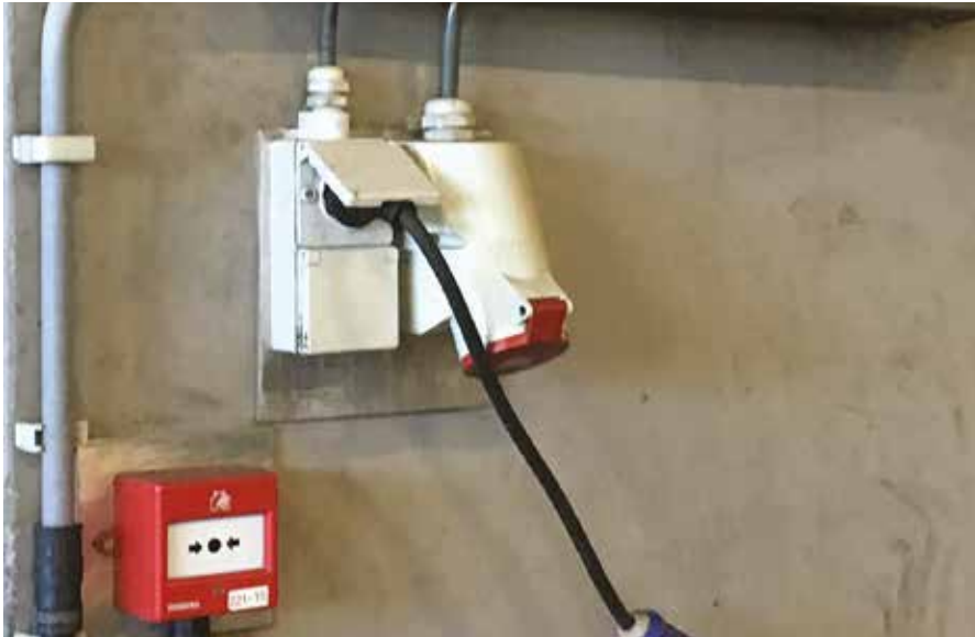
^ Oude situatie met losse contactdozen. De beveiliging zit op afstand