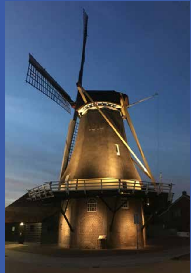
^ Horizontale lamellen voorkomen storing voor omwonenden