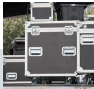
Evenementen en podiumbouw