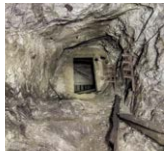
Staal- en mijnbouw