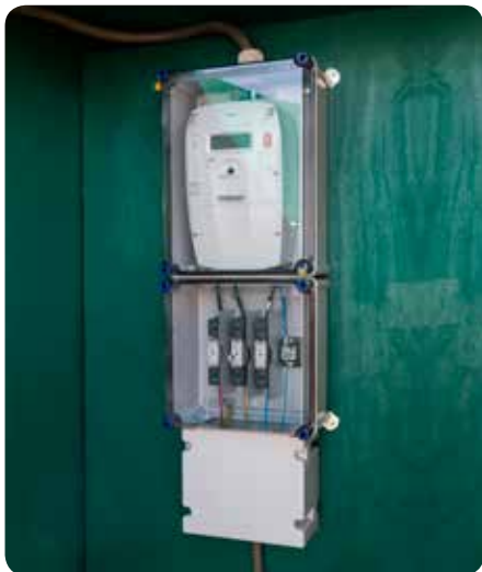
Figuur 1 Minimaal benodigde ruimte voor netbeheerder in bouwkasten.